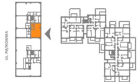
USYTUOWANIE LOKALU USŁUGOWEGO W BUDYNKU