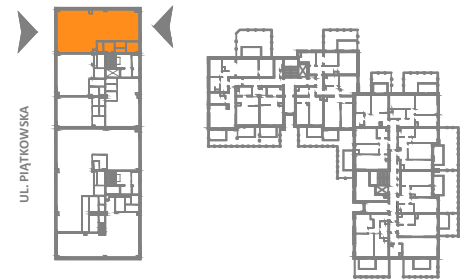
USYTUOWANIE LOKALU USŁUGOWEGO W BUDYNKU